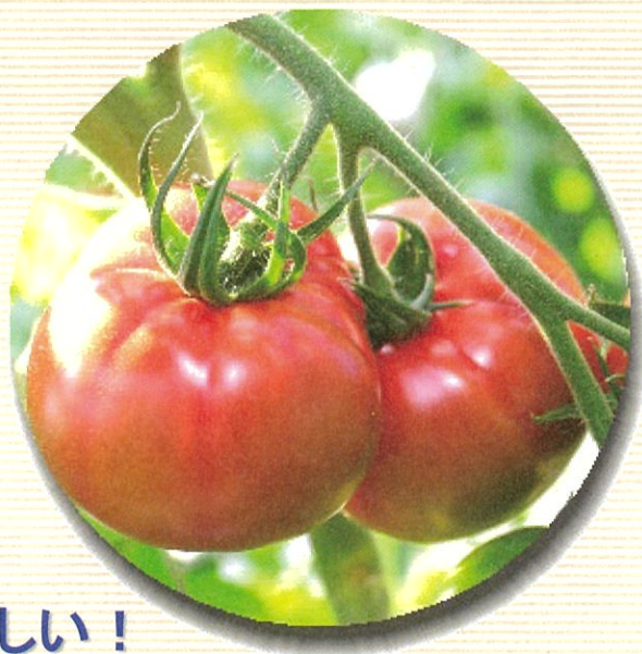
おいしい! 静岡のトマトのこだわり

静岡県には、全国に誇れる農林産物(農芸品)がたくさんあります。本県自慢の「農芸品」の“おいしさの秘密”や、“機能性”について農林技術研究所の研究員がわかりやすく説明します。トマト、イチゴの試食や“機能性表示野菜”のプレゼントもあります。お気軽に御参加ください。