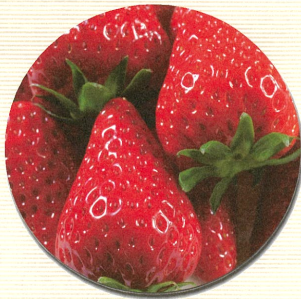
静岡イチゴの美味しさの秘密!