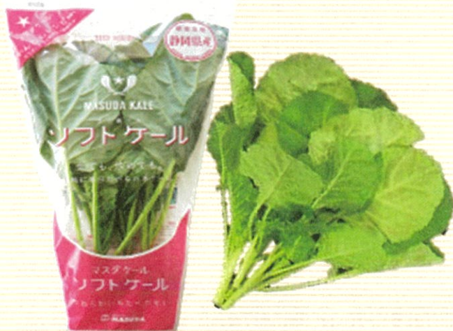
農芸品の持つ機能性

※裏面の参加申込書に御記入の上、電話、FAXまたはEメールで1月31日(金)までにお申込みください。